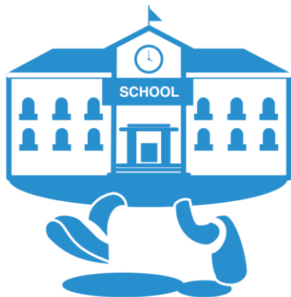
두런두런 (Do - Learn)